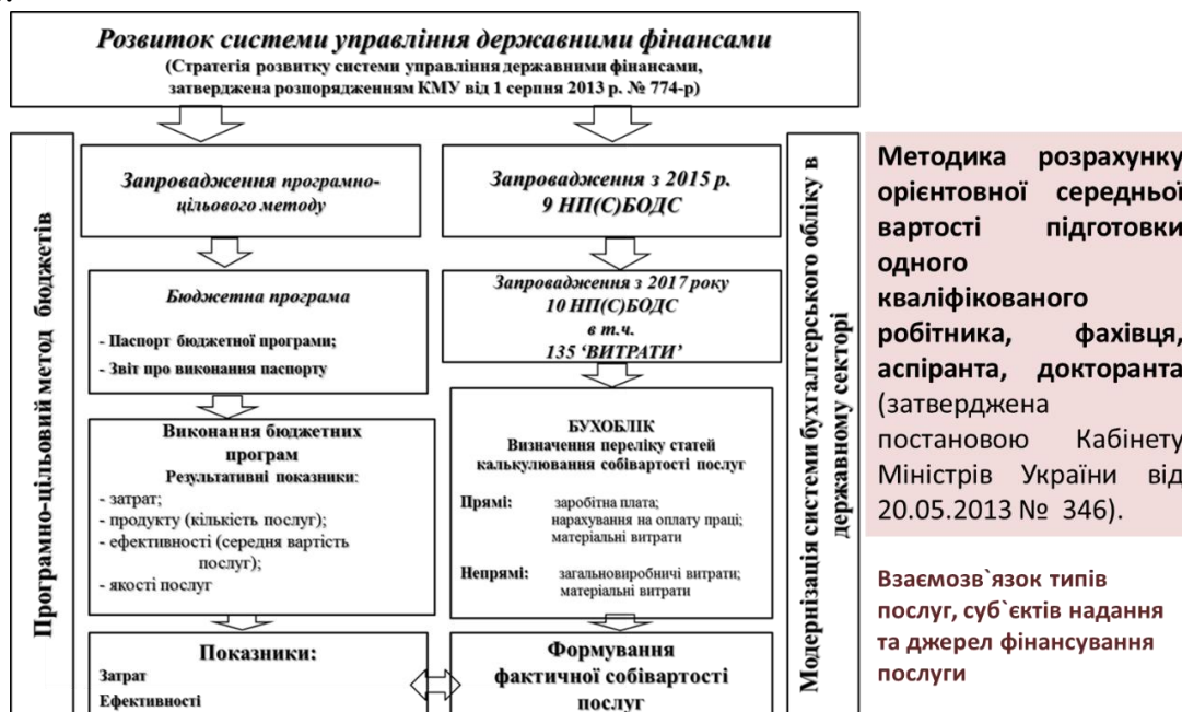
Рис. 2. Взаємозв'язок програмно-цільового методу та бухгалтерського обліку відповідно до НП(С)БОДС 135 «Витрати» (Складено автором)

Удосконалення системи державних фінансів шляхом імплементації міжнародних стандартів статистики та бухгалтерського обліку у національне законодавство відкриває нові можливості щодо отримання інформації на якісно новому рівні щодо результативних показників виконання бюджетних програм. Взаємозв'язок програмно-цільового методу у бюджетному процесі та бухгалтерського обліку відповідно до НП(С)БОДС 135 «Витрати» унаочнено на рис. 2.